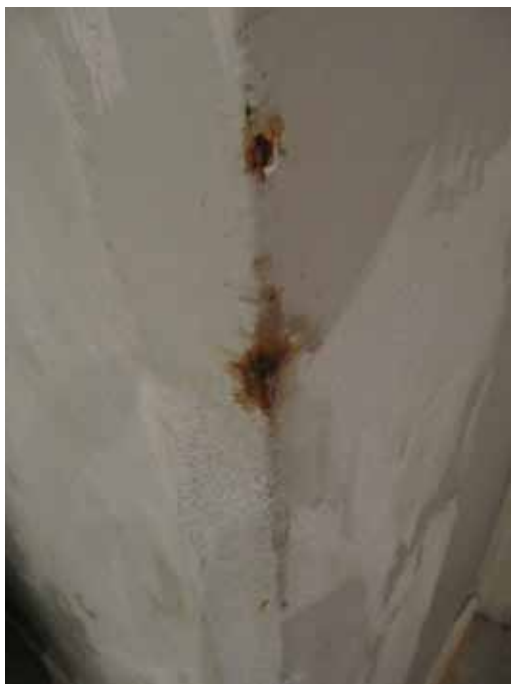
Rust i vægen over murarbejdet