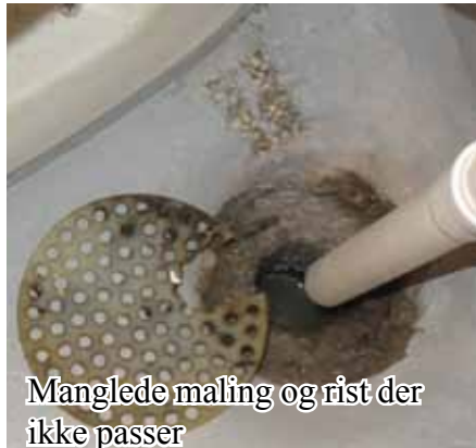
Manglende maling og rist der ikke passer