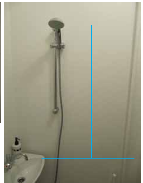
Flytning af bruserstang så den er midt i åbningen fremfor helt over vasken