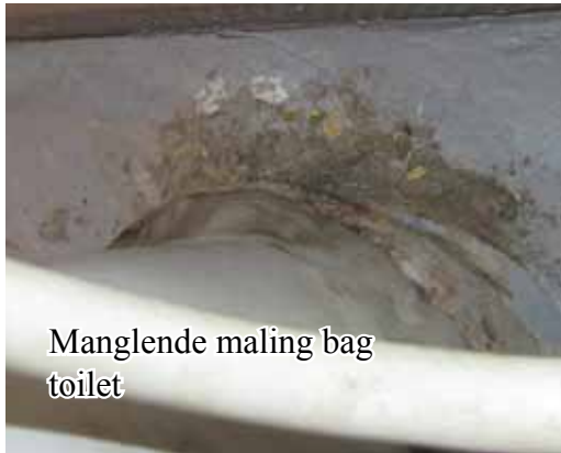
Manglende maling bag toilet