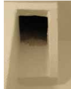
Åben udluftning der tidligere var sikret med resten