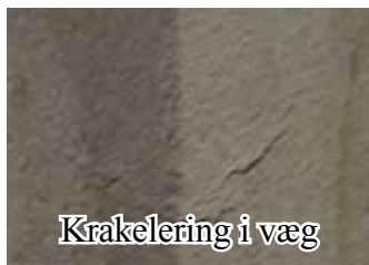
Krakelering i væg