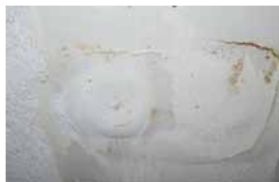
Rust i køkkenen ved murarbejdet