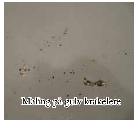
Maling på gulv krakelere